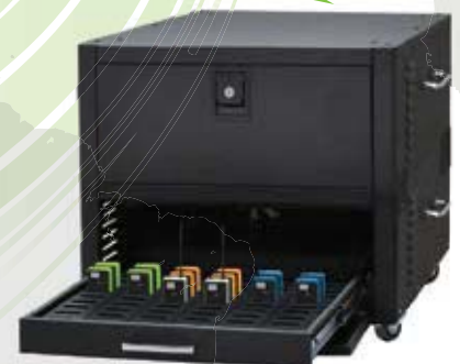
Ladestation mit Schubladen mit 60 Ladefächern, stapelbar