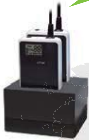
Tischladegerät mit 2 Ladefächern